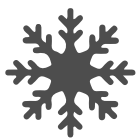
fiocco di neve