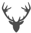
testa di cervo